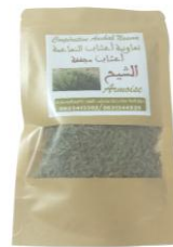
In foglie 20 gr

Prodotto della Cooperativa Aachab Naama, socia della Rete Mediterranea per lo Sviluppo e l'Economia Sociale