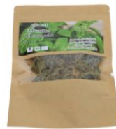
In foglie 20 gr

Prodotto della Cooperativa Aachab Naama, socia della Rete Mediterranea per lo Sviluppo e l'Economia Sociale