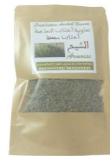
Feuilles 20 gr

Produit de la Coopérative Achab Naama, membre du Réseau Méditerranéen pour le Développement et l'Economie Sociale